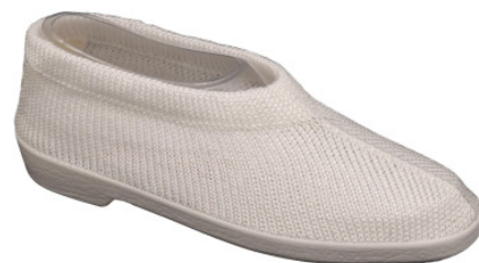
Artikel 4915106 weiss Gr. 34 – 41