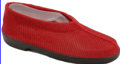
Artikel 4915104 rot Gr. 34 – 41