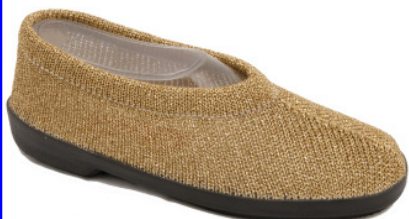
Artikel 4915103 gold Gr. 34 – 41 solange Vorrat