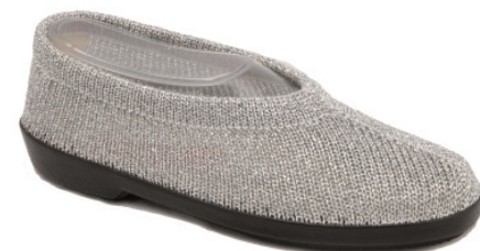
Artikel 4915107 silber Gr. 34 – 41 solange Vorrat