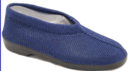
Artikel 4915108 marine Gr. 34 – 41