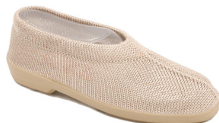
Artikel 4915102 beige Gr. 34 – 41