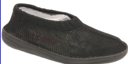
Artikel 4915120 UNISEX Gr. 35 – 43 schwarz