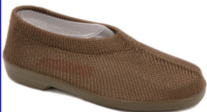
Artikel 4915105 marron Gr. 34 – 41