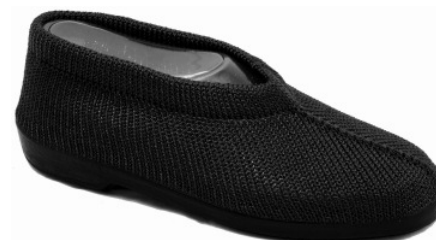
Artikel 4915100 schwarz Gr. 34 – 41