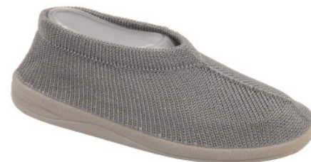
Artikel 4915129 UNISEX Gr. 35 – 43 grau